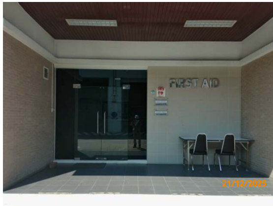
รูปที่ 3.1-1 (รูปที่ 37) ห้องพยาบาลภายในพื้นที่โรงงาน