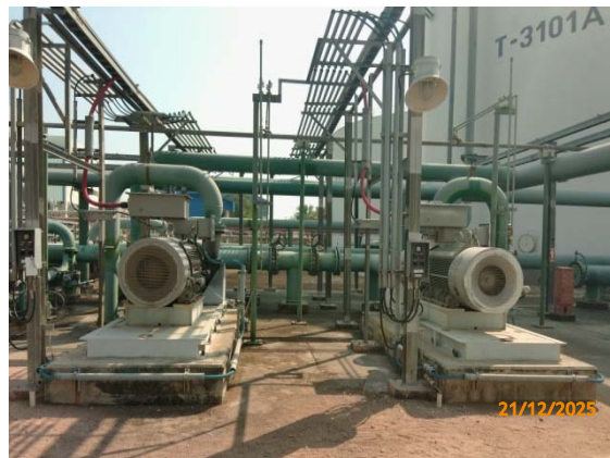
รูปที่ 3.1-1 (รูปที่ 64 Electric Jockey Pump)