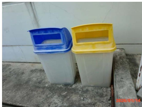
รูปที่ 3.1-1 (รูปที่ 26 ถังขยะที่มีฝาปิดมิดชิด)