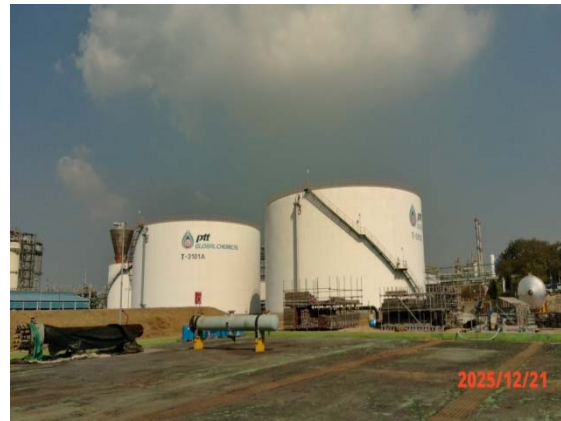
รูปที่ 3.1-1 (รูปที่ 62 Fire Water Tank (15,000 m 3 ))