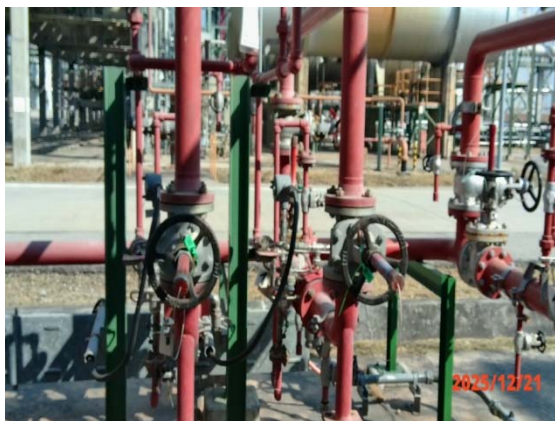
รูปที่ 3.1-1 (รูปที่ 53 Deluge Valve System)