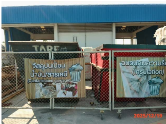
รูปที่ 3.1-1 (รูปที่ 27 การคัดแยกขยะ)