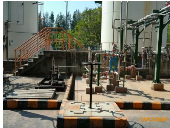
รูปที่ 3.1-1 (รูปที่ 68 วาล์วตัดแยกระบบ)