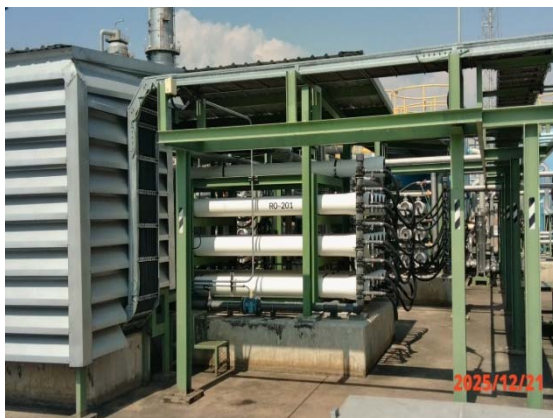
รูปที่ 3.1-1 (รูปที่ 17 ระบบผลิตน้ำแบบอาร์โอ (RO Unit))