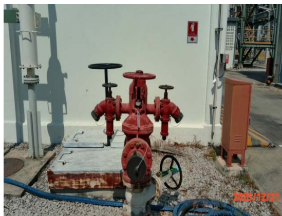
รูปที่ 3.1-1 (รูปที่ 56 Water Hydrants (Indoor & Outdoor))