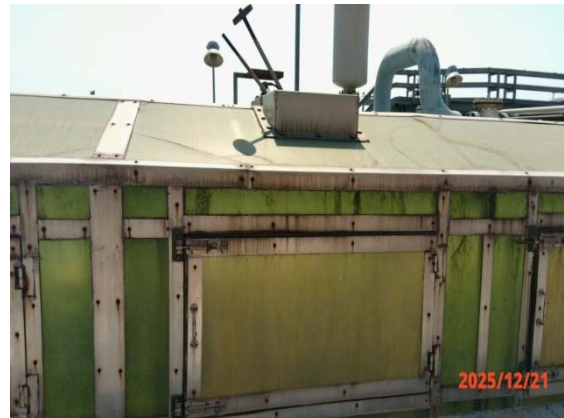
รูปที่ 3.1-1 (รูปที่ 16 Activated Sludge Basin A&B)