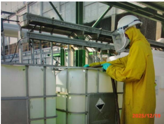
รูปที่ 3.1-1 (รูปที่ 45) การตรวจสอบการรั่วไหล ของสารเคมี)