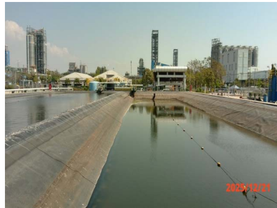
รูปที่ 3.1-1 (รูปที่ 14 บ่อพักน้ำทิ้งขนาด 4,000 ลบ.ม.)