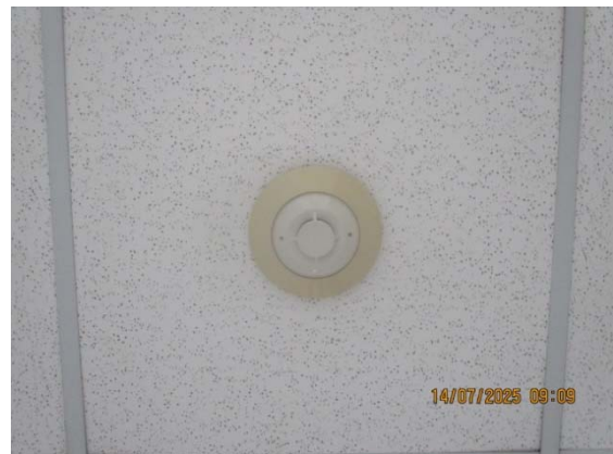
รูปที่ 3.1-1 (รูปที่ 24 Heat Detector)

รูปที่ 3.1-1 รูปถ่ายผลการปฏิบัติตามมาตรการป้องกันและแก้ไขผลกระทบสิ่งแวดล้อม โรงงานอีเทนแครกเกอร์ บริษัท พีทีที โกลบอล เคมิคอล จำกัด (มหาชน) (ระยะดำเนินการ) (ต่อ)