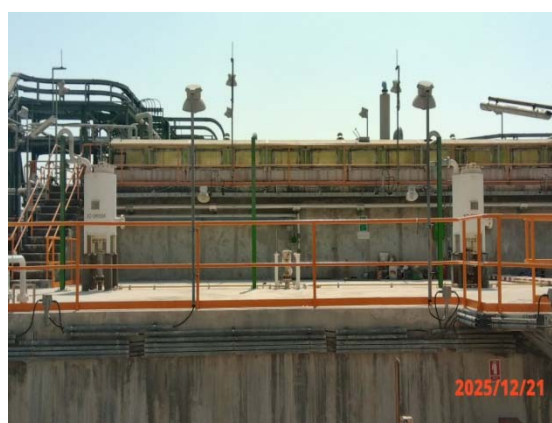
รูปที่ 3.1-1 (รูปที่ 6 ถังปรับเสมอ (Equalization Tank))

รูปที่ 3.1-1 รูปถ่ายผลการปฏิบัติตามมาตรการป้องกันและแก้ไขผลกระทบสิ่งแวดล้อม โรงงานอีเทนแครกเกอร์ บริษัท พีทีที โกลบอล เคมิคอล จำกัด (มหาชน) (ระยะดำเนินการ)