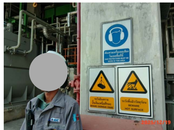
รูปที่ 3.1-1 (รูปที่ 40) พนักงานสวมใส่ อุปกรณ์ป้องกันเสียงดัง