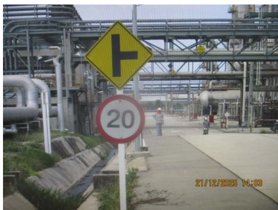
รูปที่ 3.1-1 (รูปที่ 31 ป้ายจำกัดความเร็วภายในโรงงาน ไม่เกิน 20 กม./ชม.)