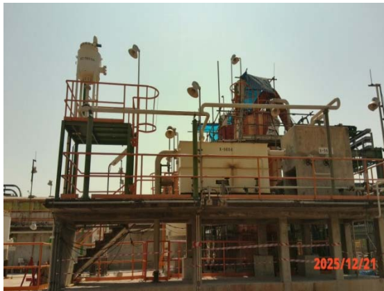
รูปที่ 3.1-1 (รูปที่ 7 ถังแยกน้ำมันแบบ CPI Oil Separator)