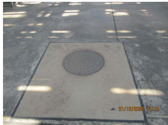
รูปที่ 3.1-1 (รูปที่ 10 ถังบำบัดน้ำเสียสำเร็จรูป (Septic Tank))