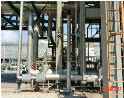
รูปที่ 3.1-1 (รูปที่ 43) การติดตั้ง Silencer บริเวณ Safety Valve ท่อไอน้ำที่ส่งกลับไปยัง บริษัท พีทีที โกลบอล เพาเวอร์ ซินเนอร์ยี จำกัด