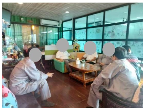
รูปที่ 3-1-1 (รูปที่ 35 การเข้าพบปะพูดคุยกับชุมชน)