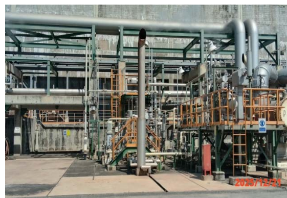
รูปที่ 3.1-1 (รูปที่ 42) การติดตั้ง Silencer บริเวณ Line Steam Vent ของระบบหล่อเย็น

รูปที่ 3.1-1 รูปถ่ายผลการปฏิบัติตามมาตรการป้องกันและแก้ไขผลกระทบสิ่งแวดล้อม โรงงานอีเทนแครกเกอร์ บริษัท พีทีที โกลบอล เคมิคอล จำกัด (มหาชน) (ระยะดำเนินการ) (ต่อ)