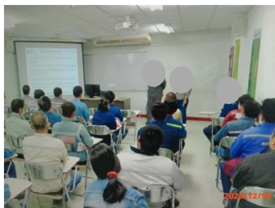
รูปที่ 3.1-1 (รูปที่ 30 การอบรมให้ความรู้กับพนักงาน)

รูปที่ 3.1-1 รูปถ่ายผลการปฏิบัติตามมาตรการป้องกันและแก้ไขผลกระทบสิ่งแวดล้อม โรงงานอีเทนแครกเกอร์ บริษัท พีทีที โกลบอล เคมิคอล จำกัด (มหาชน) (ระยะดำเนินการ) (ต่อ)