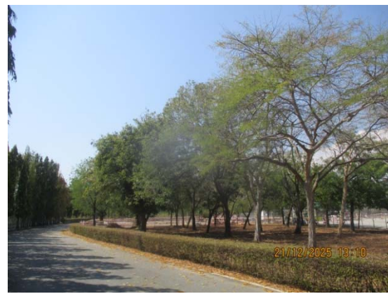
รูปที่ 3.1-1 (รูปที่ 66 พื้นที่สีเขียวของโรงงาน)

รูปที่ 3.1-1 รูปถ่ายผลการปฏิบัติตามมาตรการป้องกันและแก้ไขผลกระทบสิ่งแวดล้อม โรงงานอีเทนแครกเกอร์ บริษัท พีทีที โกลบอล เคมิคอล จำกัด (มหาชน) (ระยะดำเนินการ) (ต่อ)