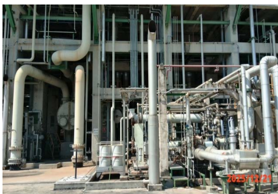
รูปที่ 3.1-1 (รูปที่ 41) การติดตั้ง Silencer บริเวณ Change Gas Compressor