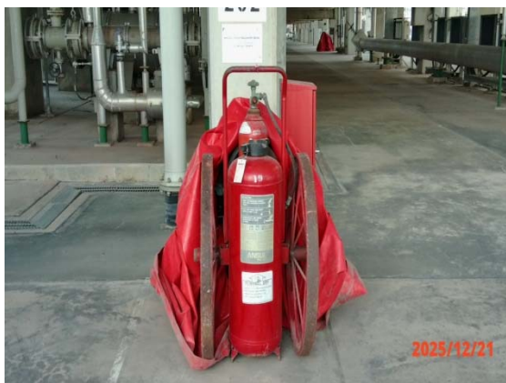
รูปที่ 3.1-1 (รูปที่ 55 Wheeled Fire Extinguisher)