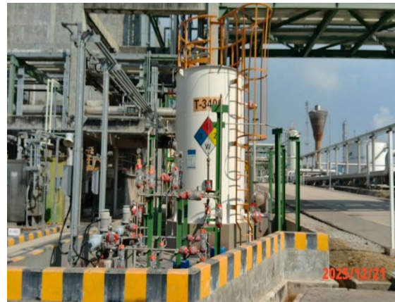
รูปที่ 3.1-1 (รูปที่ 50 ภาชนะจัดเก็บสารเคมี)