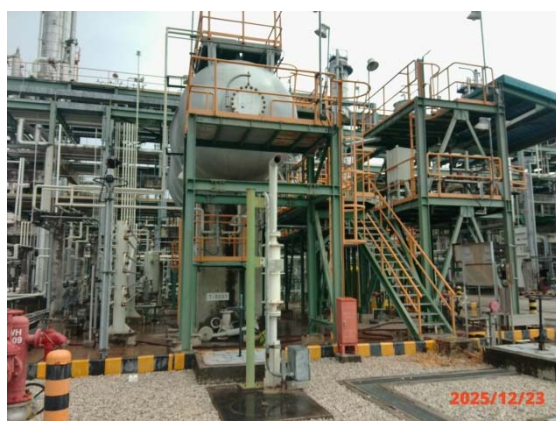
รูปที่ 3.1-1 (รูปที่ 47) คันคอนกรีตล้อมรอบถังเก็บกัก Cracker Bottom)