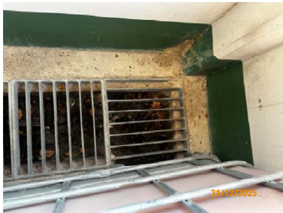
รูปที่ 3.1-1 (รูปที่ 21 รางระบายรวบรวมน้ำเสีย ภายในอาคารเก็บกากของเสีย)