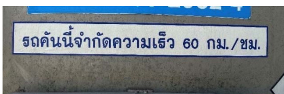
รูปที่ 3.1-1 (รูปที่ 33 สัญลักษณ์จำกัดความเร็ว รถขนส่งสารเคมีไม่เกิน 45 และ 60 กม./ชม.)