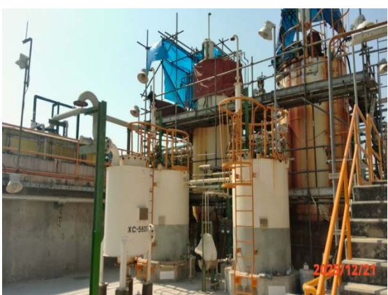
รูปที่ 3.1-1 (รูปที่ 5 ถังปรับสภาพให้เป็นกลาง)