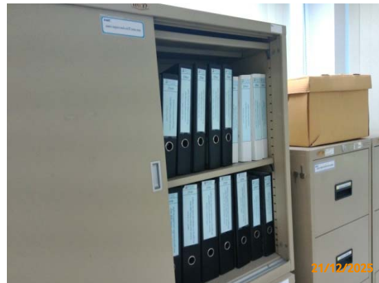
รูปที่ 3.1-1 (รูปที่ 70 แฟ้มเอกสารการบันทึกข้อมูล สุขภาพของพนักงานและผู้รับเหมาที่ห้องพยาบาล)

รูปที่ 3.1-1 รูปถ่ายผลการปฏิบัติตามมาตรการป้องกันและแก้ไขผลกระทบสิ่งแวดล้อม โรงงานอีเทนแครกเกอร์ บริษัท พีทีที โกลบอล เคมิคอล จำกัด (มหาชน) (ระยะดำเนินการ) (ต่อ)