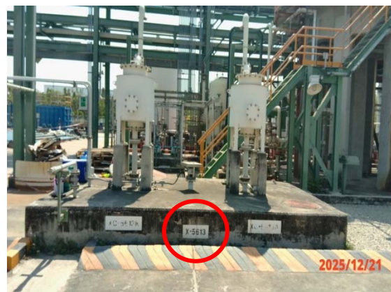
รูปที่ 3.1-1 (รูปที่ 8 ถัง Oil Pit)