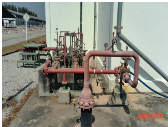
รูปที่ 3.1-1 (รูปที่ 23 ระบบดับเพลิง/ Fire Extinguisher)