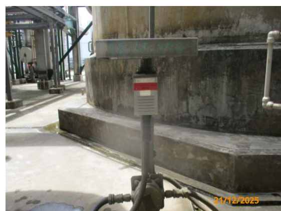
รูปที่ 3.1-1 (รูปที่ 48) Fixed Gas Detector)

รูปที่ 3.1-1 รูปถ่ายผลการปฏิบัติตามมาตรการป้องกันและแก้ไขผลกระทบสิ่งแวดล้อม โรงงานอีเทนแครกเกอร์ บริษัท พีทีที โกลบอล เคมิคอล จำกัด (มหาชน) (ระยะดำเนินการ) (ต่อ)