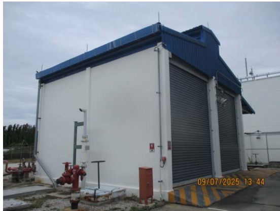
รูปที่ 3.1-1 (รูปที่ 19 อาคารเก็บกากของเสีย)