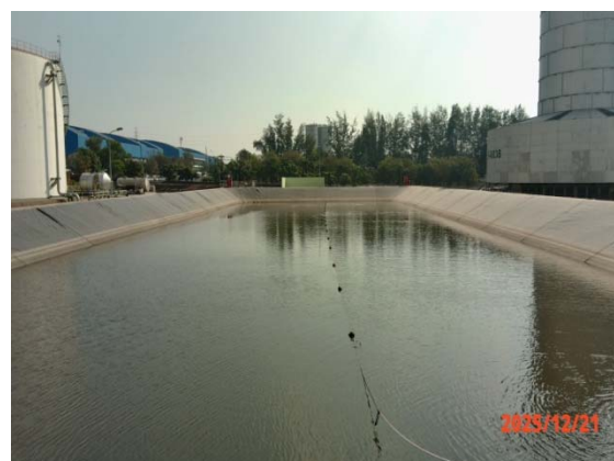
รูปที่ 3.1-1 (รูปที่ 12 บ่อพักน้ำทิ้งขนาด 1,200 ลบ.ม.)

รูปที่ 3.1-1 รูปถ่ายผลการปฏิบัติตามมาตรการป้องกันและแก้ไขผลกระทบสิ่งแวดล้อม โรงงานอีเทนแครกเกอร์ บริษัท พีทีที โกลบอล เคมิคอล จำกัด (มหาชน) (ระยะดำเนินการ) (ต่อ)