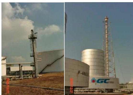
รูปที่ 3.1-1 (รูปที่ 3 หอเผาความดันต่ำ หอเผาความดันสูง และหอแยกชนิด EGF)