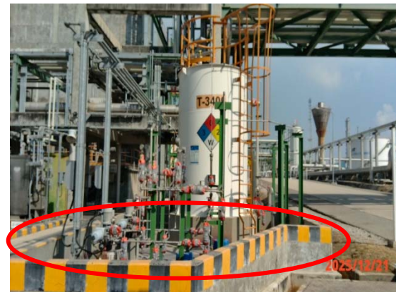
รูปที่ 3.1-1 (รูปที่ 46) คันคอนกรีตล้อมรอบ ถังกักเก็บสารเคมี)