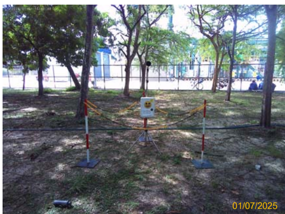
รูปที่ 3.1-1 (รูปที่ 29 การตรวจวัดระดับเสียงริมรั้วโรงงาน)