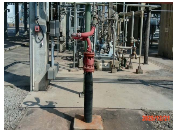
รูปที่ 3.1-1 (รูปที่ 54 Water Fix Monitor)

รูปที่ 3.1-1 รูปถ่ายผลการปฏิบัติตามมาตรการป้องกันและแก้ไขผลกระทบสิ่งแวดล้อม โรงงานอีเทนแครกเกอร์ บริษัท พีทีที โกลบอล เคมิคอล จำกัด (มหาชน) (ระยะดำเนินการ) (ต่อ)