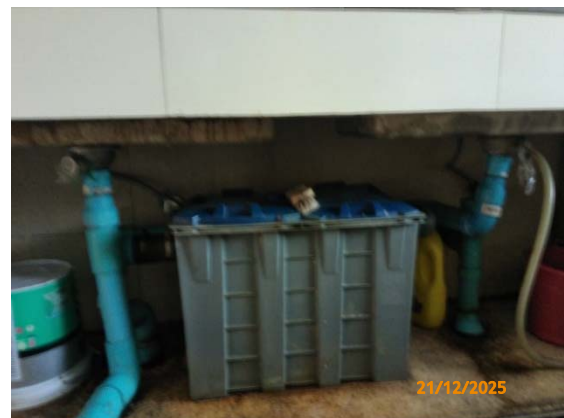
รูปที่ 3.1-1 (รูปที่ 18 ถังคักไขมันที่โรงอาหาร)

รูปที่ 3.1-1 รูปถ่ายผลการปฏิบัติตามมาตรการป้องกันและแก้ไขผลกระทบสิ่งแวดล้อม โรงงานอีเทนแครกเกอร์ บริษัท พีทีที โกลบอล เคมิคอล จำกัด (มหาชน) (ระยะดำเนินการ) (ต่อ)