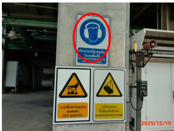
รูปที่ 3.1-1 (รูปที่ 39) ป้ายเตือนให้สวมใส่ อุปกรณ์ป้องกันเสียงดัง