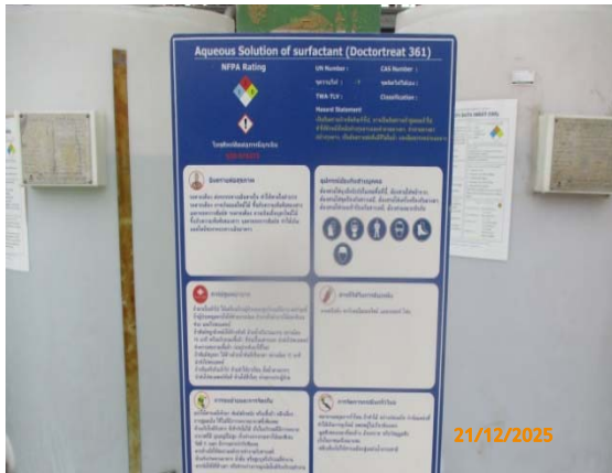
รูปที่ 3.1-1 (รูปที่ 49 ข้อมูลความปลอดภัยของสารเคมี ที่ติดไว้บริเวณสถานที่ทำงาน)