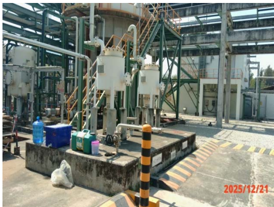
รูปที่ 3.1-1 (รูปที่ 9 ถังแยกน้ำมันแบบ DAF)