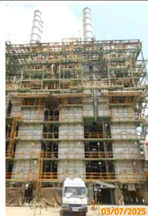
รูปที่ 3.1-1 (รูปที่ 2 ตัวอย่างการตรวจวัด คุณภาพอากาศจากแหล่งกำเนิด)