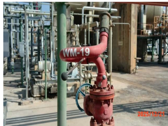
รูปที่ 3.1-1 (รูปที่ 52 Water Hydrants with Monitors)