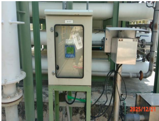
รูปที่ 3.1-1 (รูปที่ 13 COD Online)