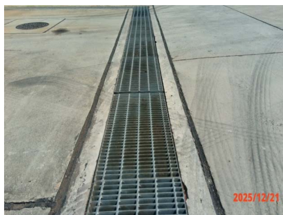
รูปที่ 3.1-1 (รูปที่ 11 รางระบายน้ำฝนภายในโรงงาน)