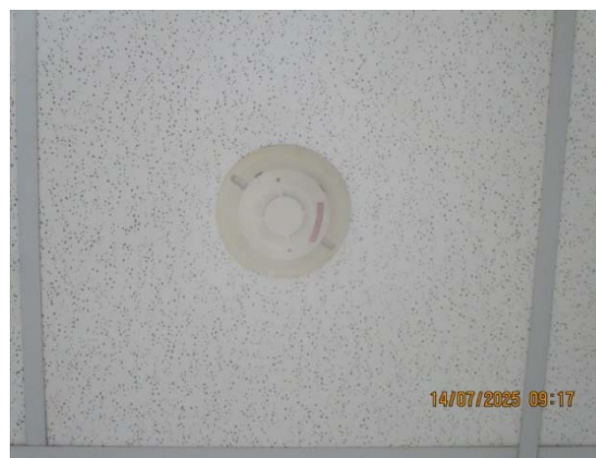
รูปที่ 3.1-1 (รูปที่ 60 Smoke Detector)

รูปที่ 3.1-1 รูปถ่ายผลการปฏิบัติตามมาตรการป้องกันและแก้ไขผลกระทบสิ่งแวดล้อม โรงงานอีเทนแครกเกอร์ บริษัท พีทีที โกลบอล เคมิคอล จำกัด (มหาชน) (ระยะดำเนินการ) (ต่อ)