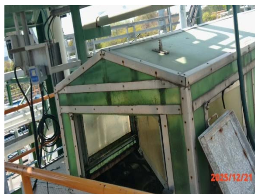
รูปที่ 3.1-1 (รูปที่ 4 ระบบบำบัดน้ำเสีย ทางชีวภาพแบบเอเอส)