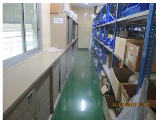
รูปที่ 3.1-1 (รูปที่ 36 พื้นที่เก็บจ่ายอุปกรณ์ ป้องกันอันตรายส่วนบุคคล)

รูปที่ 3.1-1 รูปถ่ายผลการปฏิบัติตามมาตรการป้องกันและแก้ไขผลกระทบสิ่งแวดล้อม โรงงานอีเทนแครกเกอร์ บริษัท พีทีที โกลบอล เคมิคอล จำกัด (มหาชน) (ระยะดำเนินการ) (ต่อ)