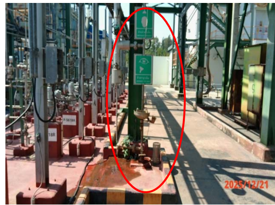
รูปที่ 3.1-1 (รูปที่ 22 Shower & Eyes Washer)