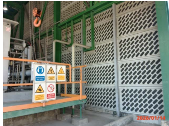
รูปที่ 3.1-1 (รูปที่ 44) การติดตั้งผนังกันเสียง บริเวณ Decoke Air Compressor)