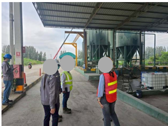
รูปที่ 3.1-1 (รูปที่ 25 ระบบติดตาม (Audit) หน่วยงานรับกำจัดกากของเสีย)