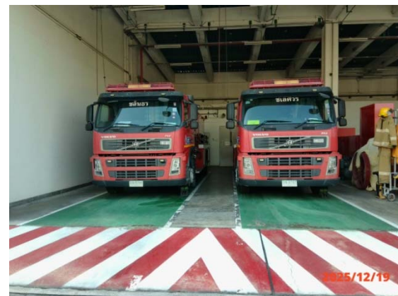
รูปที่ 3.1-1 (รูปที่ 65 รถดับเพลิง)