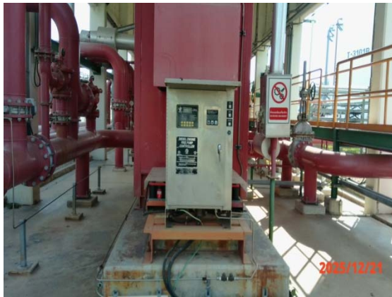
รูปที่ 3.1-1 (รูปที่ 61 Diesel Fire Pump)