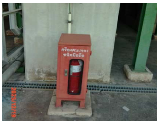
รูปที่ 3.1-1 (รูปที่ 57 Fire Extinguishers)