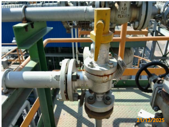
รูปที่ 3.1-1 (รูปที่ 67 Safety Valve (Relief & Vacuum Valve และ Shut off Valve))