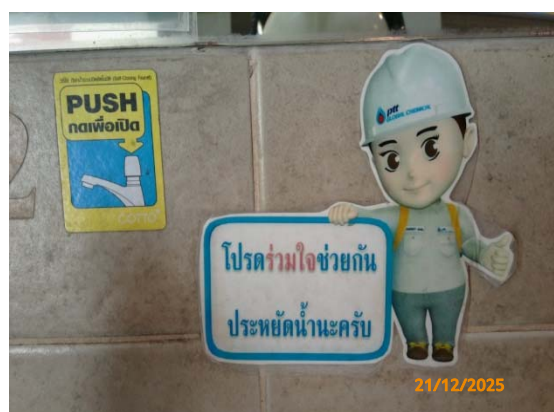
รูปที่ 3.1-1 (รูปที่ 34 สื่อประชาสัมพันธ์การใช้น้ำ)