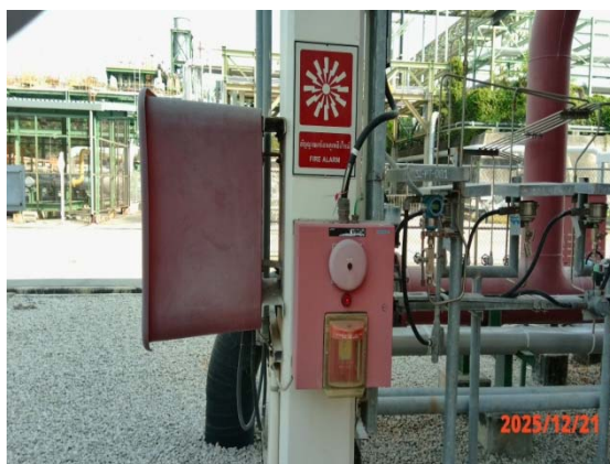
รูปที่ 3.1-1 (รูปที่ 59 Manual Fire Alarm)