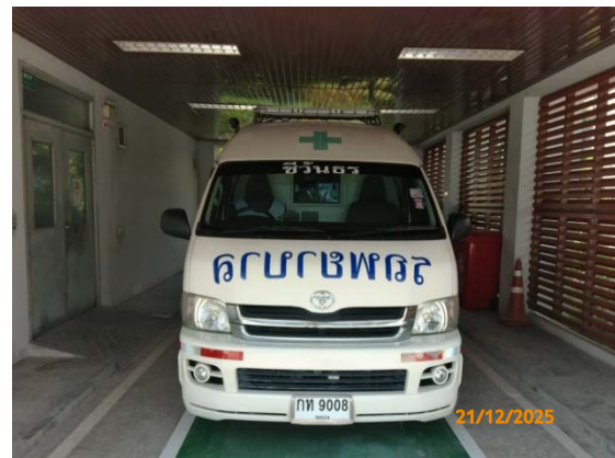
รูปที่ 3.1-1 (รูปที่ 38) รถรับส่งในกรณีฉุกเฉิน