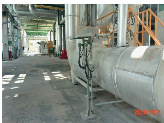
รูปที่ 3.1-1 (รูปที่ 28 ติดตั้งวัสดุอุดซับเสียง)