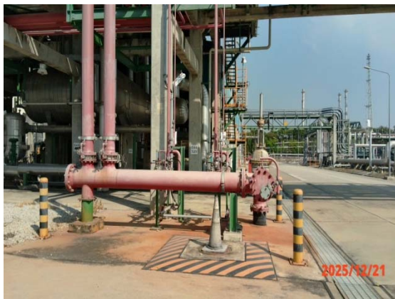
รูปที่ 3.1-1 (รูปที่ 51 Water Spray System)