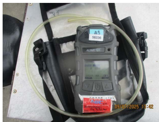
รูปที่ 3.1-1 (รูปที่ 58 Combustible Gas Detector)