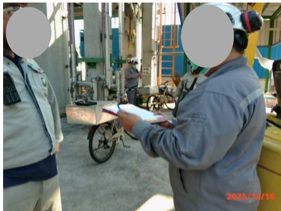
รูปที่ 3.1-1 (รูปที่ 69 การตรวจในพื้นที่ กระบวนการผลิต)