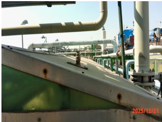
รูปที่ 3.1-1 (รูปที่ 15 ฝารอบบ่อน้ำคั่งน้ำเสีย)