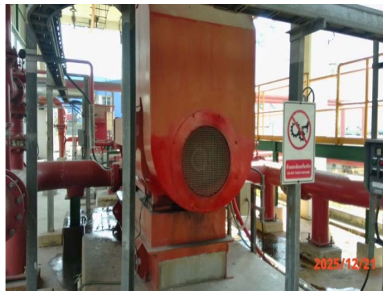
รูปที่ 3.1-1 (รูปที่ 63 Electric Fire Pump)