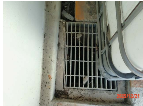
รูปที่ 3.1-1 (รูปที่ 20 ปอรวรรมน้ำเสียที่หกั่วไหล จากอาคารเก็บกากของเสีย)